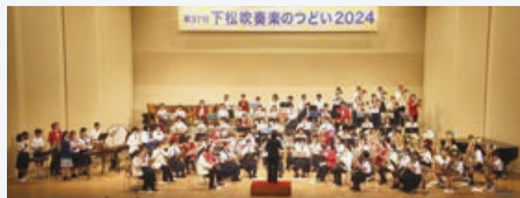
演奏する小中高と市吹奏楽団の合同バンド

9月15日、下松市のスターピアくだまつ大ホールで第37回下松吹奏楽のつどいが開かれた。市内小中高9校の吹奏楽部や金管バンドクラブ計319人が出演し、息のあった演奏で観客を魅了した。