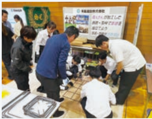
末延建設の企業ブース