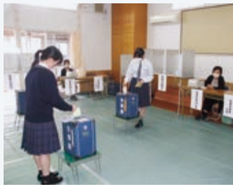
投票する生徒たち(聖光高)

光市選挙管理委員会は、18歳になった高校生に参政権への意識を高めてもらうと、10月24日に聖光高校、25日に光高校に期日前投票所を設置した。周南3市で高校内に期日前投票所が設置されたのは初めて。生徒や教職員、近隣住民らが投票に訪れた。